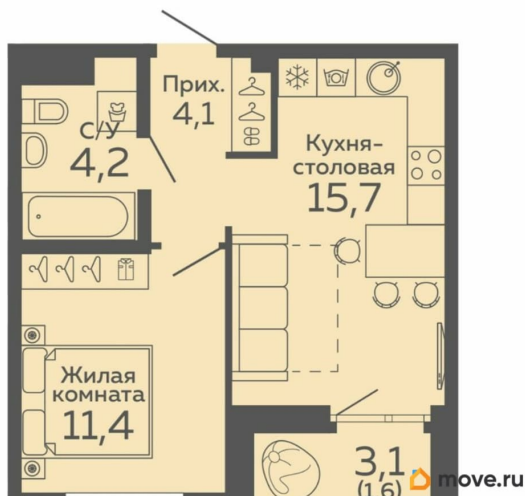
ПЛАН 2 ЭТАЖА 3 секция

экономики и управления, Специализированного учебно-научного центра (СУНЦ) близки к полной готовности. Инфраструктура района позволит получать образовательные, медицинские и бытовые услуги рядом с домом. Приватное пространство двора для семейного отдыха, общения и прогулок, плейхаб для активных игр и занятий спортом, стильный дизайн интерьеров холлов, детская игровая комната, видеонаблюдение и система контроля доступа, функциональные планировки с крупноформатными окнами и панорамными лоджиями. Уютная однокомнатная квартира находится на втором этаже. Окна выходят на сторону закрытого внутреннего двора, что обеспечивает спокойствие и тишину. Риэлторов ПРОСЬБА НЕ БЕСПОКОИТЬ!